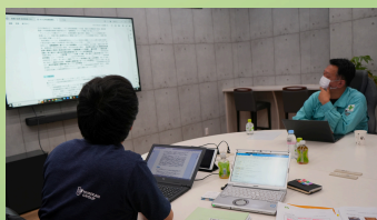
資源循環戦略会議の様子